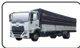
THÙNG MUI BẬT