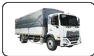
THÙNG MUI BẠT